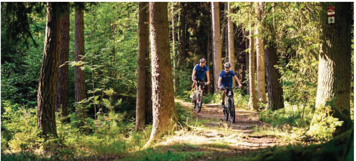
Radeln im Stiftland